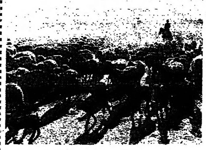
مراع ، لكنها فنون

تجربة جديدة أجرتها شركة جنرال إلكتريك في المصانع الأمريكية ، فقد سمحت لموظفيها بالبقاء في مناصبهم في وقت السلم ، وفي وقت الحرب ، وفي وقت السلم ، وفي وقت الحرب ، وفي وقت السلم ، وفي وقت الحرب .